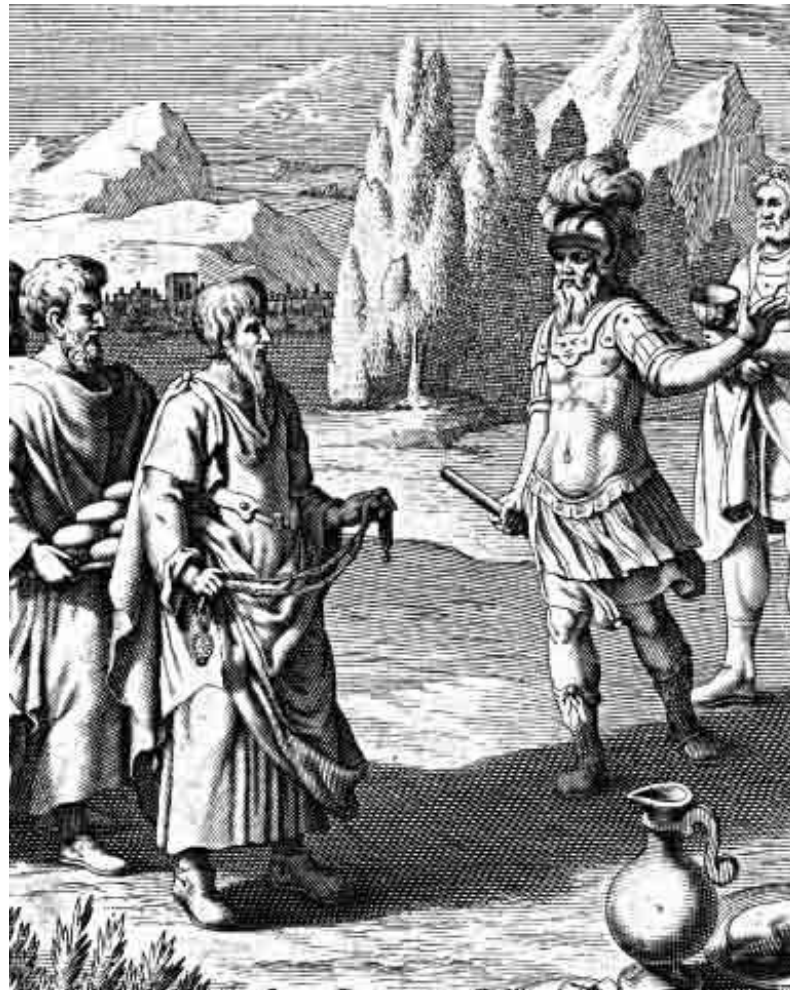
Ο ΑΓΗΣΙΛΑΟΣ, Ο ΒΑΣΙΛΙΑΣ ΤΗΣ ΣΠΑΡΤΗΣ

Οι ελληνικές πόλεις της Μ. Ασίας και η Κύπρος πέρασαν στην περσική κυριαρχία.