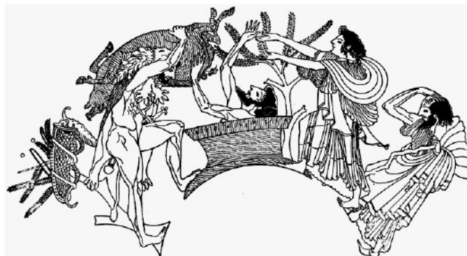
Ο Ευρυσθέας τρομάζει και κρύβεται στο πιθάρι.