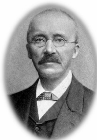
Ερρίκος Σλήμαν Ανακάλυψε τις Μυκήνες.