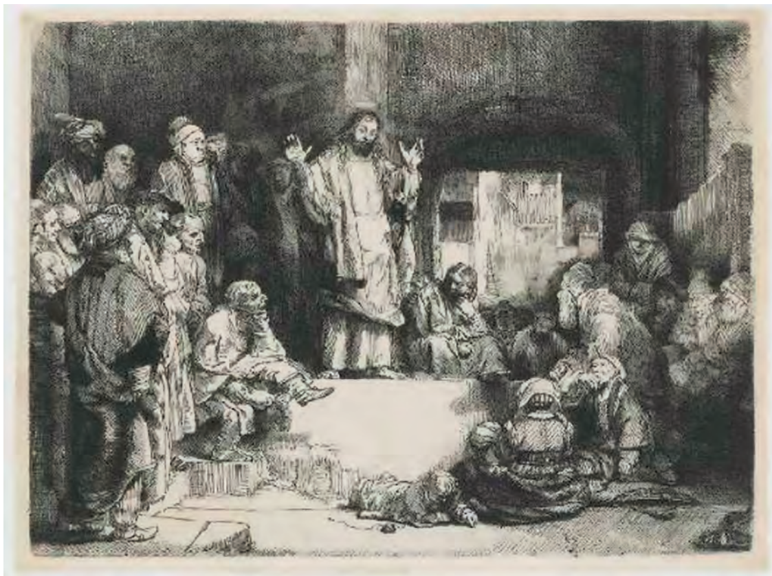
«Ο Χριστός διδάσκων», χαρακτηριστικό του Ρέμπραντ.