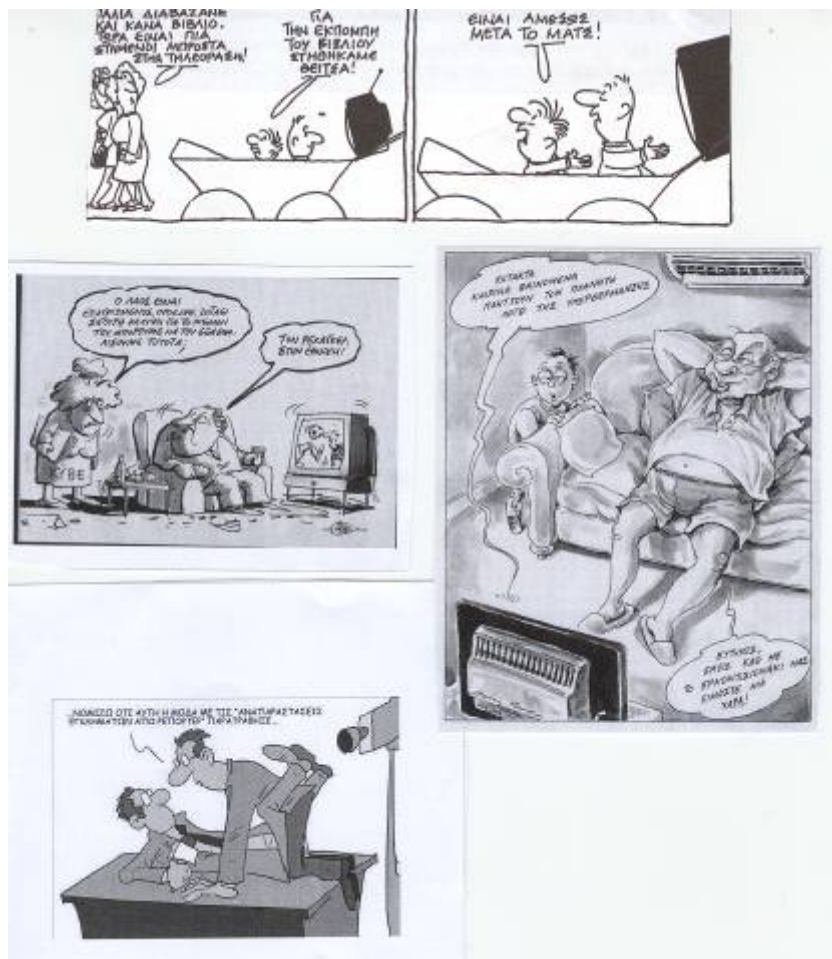
Τάξη Ε', Σχολικό έτος 2007 - 2008