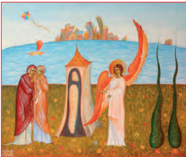
Θρησκευτικά Γ' Δημοτικού, 1992

Η συνάντηση πραγματοποιήθηκε σύντομα. Ο Ιησούς φανερώθηκε μπροστά τους και τους είπε: «Ειρήνη σ' εσάς». Εκείνοι, όταν τον είδαν, έπεσαν και τον προσκύνησαν. «Να έχετε πάντα ειρήνη», τους είπε ξανά και συνέχισε: «Πηγαίνετε να κάνετε όλους τους ανθρώπους μαθητές μου. Να τους βαπτίζετε στο όνομα του Πατρός και του Υιού και του Αγίου Πνεύματος. Να τους διδάσκετε να τηρούν όλες τις εντολές που σας έδωσα. Κι εγώ θα είμαι μαζί σας για πάντα, όσο θα υπάρχει κόσμος. Αμήν».