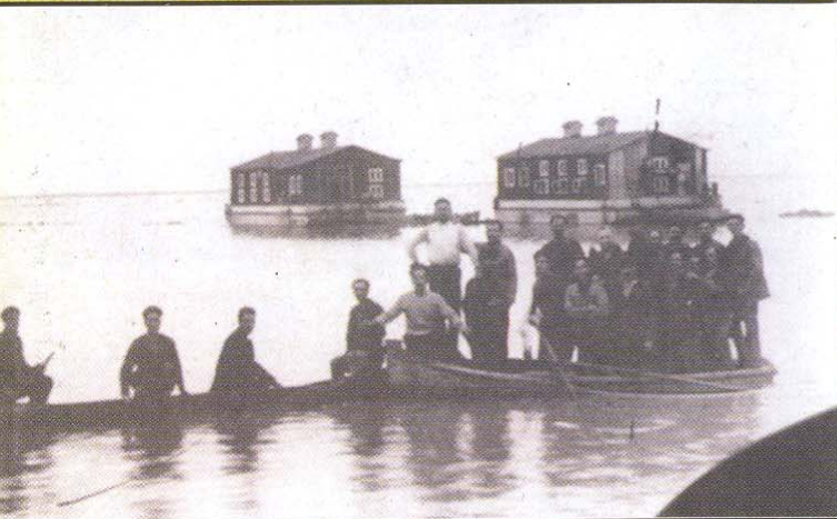
Εικόνες από την αποξήρανση της λίμνης των Γιαννιτών