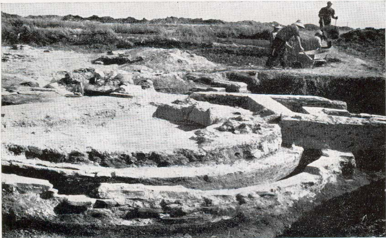
α. Ἡ πύελος μετὰ τοῦ ἡμικυκλικοῦ ἀγωγοῦ, ὁρῶμενα ἀπὸ ΒΔ.