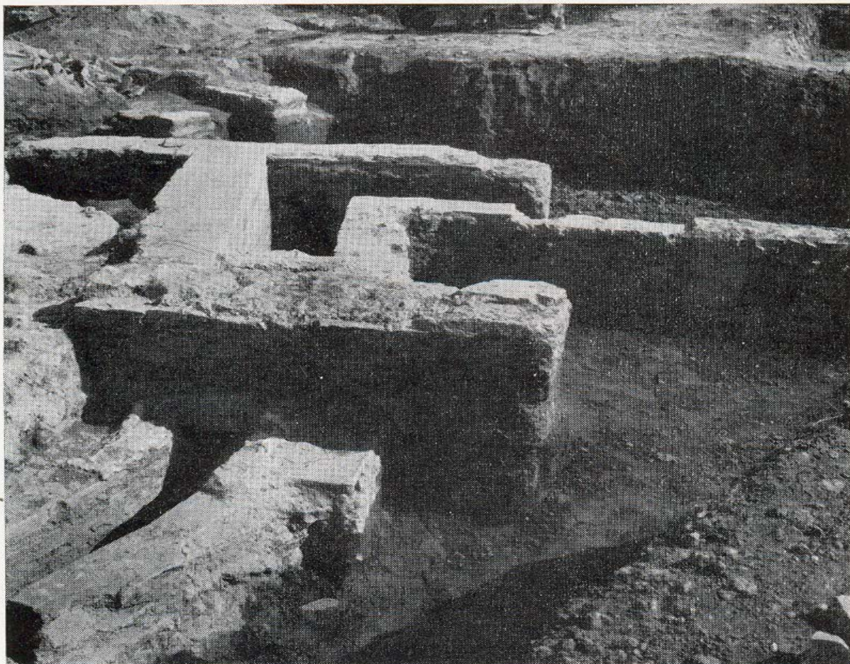
β. Ὁ ἀγωγὸς κατὰ τὸ σημεῖον τῆς πρὸς τὰ ΝΔ. κάμψεώς του.