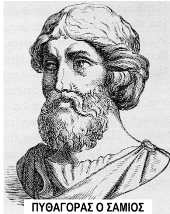
ΠΥΘΑΓΟΡΑΣ Ο ΣΑΜΙΟΣ