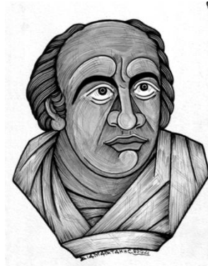
ΕΚΑΤΑΙΟΣ Ο ΜΙΛΗΣΙΟΣ

Κάποιοι θέλησαν να γράψουν για τα περασμένα, για να μην ξεχαστούν.