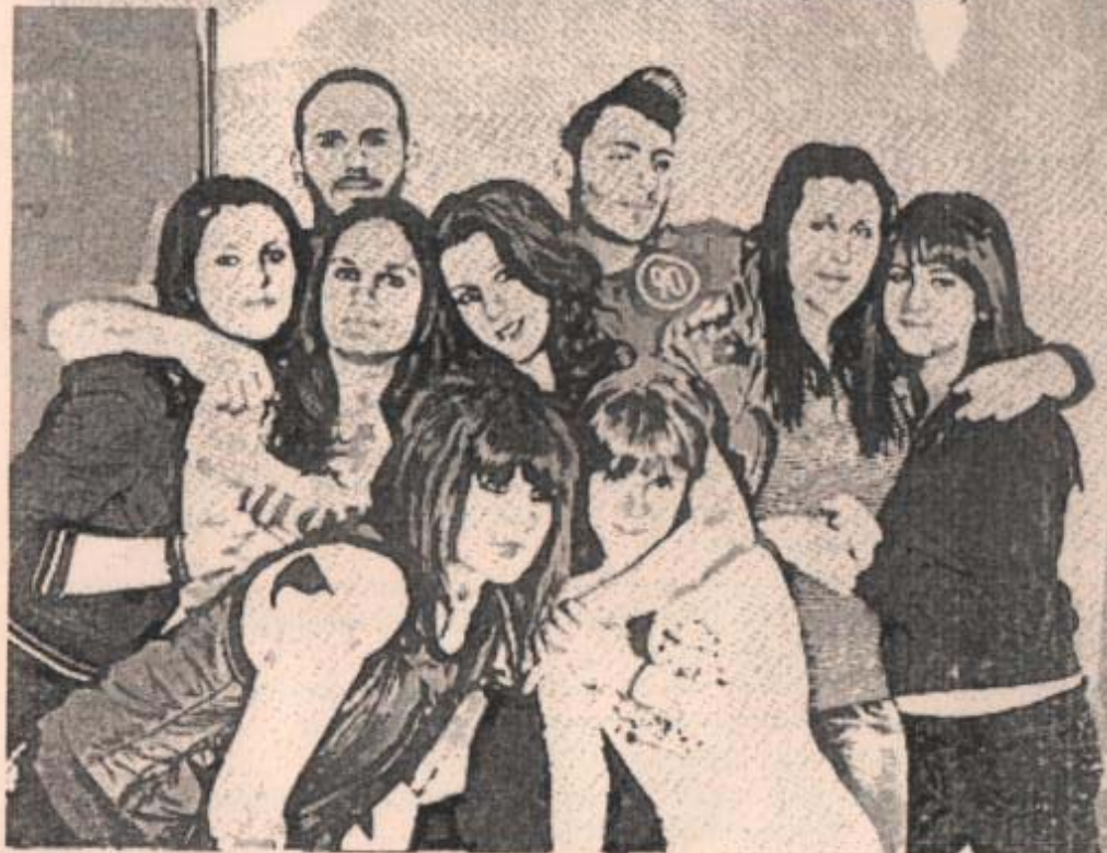
Επιμέλεια εντύπων: Σαμαρά Θεοδώρα (Πληροφορικός ΠΕ19)

ΠΙΠΕΡΙΔΟΥ ΑΡΓΥΡΗ (Αισθητικός ΠΕ1804) ΓΙΑΝΝΟΥΣΟΠΟΥΛΟΥ ΑΡΓΥΡΟΥΛΑ (Αισθητικός ΠΕ1804)