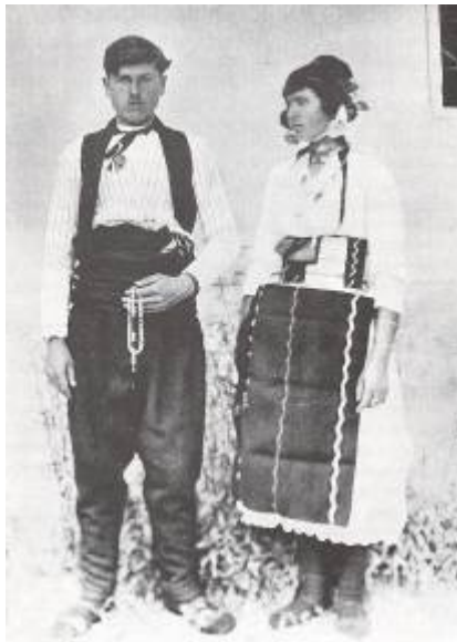
Φωτ. 8 - Ζεύγος Ρουμλουκιωτών

Τότε λοιπόν κάτω από τη λίμνη των Γιαννισών απλώνονταν η Καμπανία πεδιάδα, μεταξύ Αλιάκμονα – Αξιού, η οποία κατοικούνταν κυρίως από Έλληνες, όπως και η περιοχή του Βερμίου. Οι εκτάσεις αυτές σκεπάζονταν από μεγάλα δάση. Στην περιοχή αυτή της Καμπανίας, την γνωστή κυρίως με το όνομα Ρουμλούκι (χώρα των Ρωμαίων, των Ελλήνων), οι κάτοικοί της, απομονωμένοι και ασφαλισμένοι από τον έξω κόσμο συντηρούσαν τον λαϊκό τους πατροπαράδοτο πολιτισμό, τα ήθη και έθιμά τους, τον τρόπο ζωής τους, τις φορεσιές τους κ.λ.π