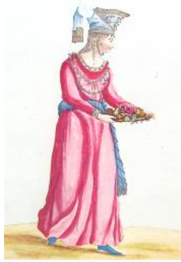
ΦΩΤ. 2. - Γυναίκα της Μακεδονίας

Πραγματικά η κίνηση αυτή είχε ευεργετικό αντίκτυπο ιδίως στη δυτική και κεντρική Μακεδονία. Οι Γερμανοί και οι χώρες των Αψβούργων ζητούσαν και αγόραζαν σημαντικές ποσότητες βαμβακιού, κατεργασμένου ή ακατέργαστου, που βαφόταν κόκκινο στα εργαστήρια της Βέροιας το διοχέτευαν στις άλλες χώρες της Ευρώπης. Επίσης αγόραζαν μαλλί, καπνό και βαμβακερά νήματα. Τα ασημένια αυστριακά νομίσματα των Αψβούργων με τους δικάφαλους αετούς, που βλέπουμε σε κοσμήματα των γυναικών του Ρουμλουκιού είναι αδιάψευστη απόδειξη για εκείνη τη μεγάλη οικονομική αλλαγή.