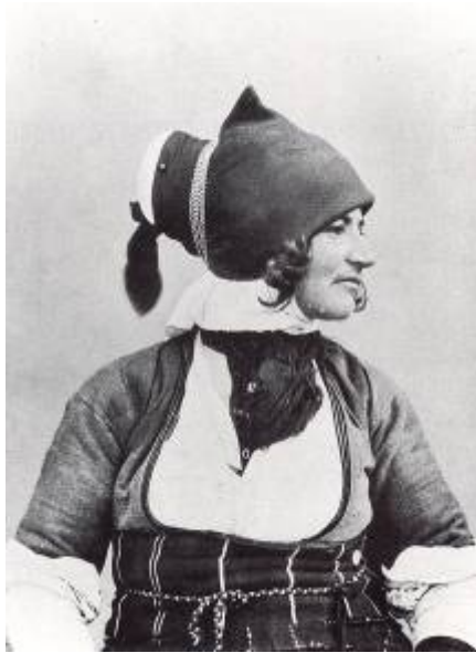
Φωτ. 20. - Γυναίκα του Γιδά

Τον Ιούνιο 1822 από εδώ πέρασαν από δω οι εξανδραποδισθέντες και μεταφερθέντες τριάντα εξ Βεροιοίς υπό τον Γιουνούζ αγά, τα εξανδραποδισθέντα γυναικόπαιδα από τα χωριά Άνω και Κάτω Λοζίτσα., από το χωριό Δοβρά υπό τον Σουρουτζή-μπασή Αβδούλ Βαχήτ αγά