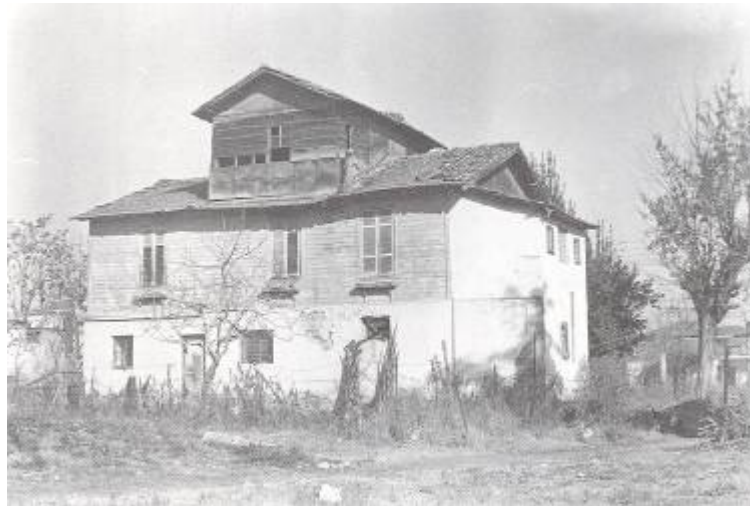
Φωτ. 7 - Κονάκι

περιφέρειας, με τον οποίο είχαν επικοινωνία και ουσιαστικά λειτουργούσαν ως δικοί τους κατάσκοποι.