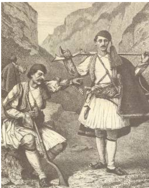
Φωτ. 6. - Κλεφταρματολοί

Κοντά στους κλεφταρματολούς, πάνω στα κοντινά βουνά βρισκόταν ακόμη και οι ελεύθεροι οικισμοί των ανυπότακτων συγγενών, συγχωριανών και φίλων των ρουμλουκιωτών, οι οποίοι, λόγω των καταπιέσεων που αντιμετώπιζαν στα καμπίσια χωριά τους, κάποτε έπαιρναν την απόφαση να φύγουν από τον κάμπο και να πάνε να ζήσουν ελεύθεροι «σ' τς απάν», γι' αυτό και τους λέγανε «Τσιαπανιτέους».