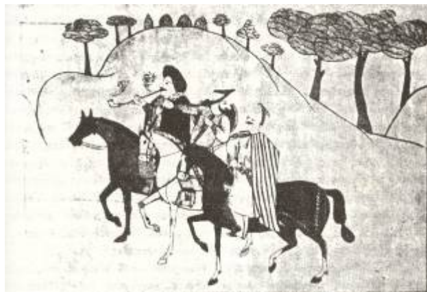
Φωτ. 3 - Σπαχήδες

Πραγματικά η κίνηση αυτή είχε ευεργετικό αντίκτυπο ιδίως στη δυτική και κεντρική Μακεδονία. Οι Γερμανοί και οι χώρες των Αψβούργων ζητούσαν και αγόραζαν σημαντικές ποσότητες βαμβακιού, κατεργασμένου ή ακατέργαστου, που βαφόταν κόκκινο στα εργαστήρια της Βέροιας το διοχέτευαν στις άλλες χώρες της Ευρώπης. Επίσης αγόραζαν μαλλί, καπνό και βαμβακερά νήματα. Τα ασημένια αυστριακά νομίσματα των Αψβούργων με τους δικάφαλους αετούς, που βλέπουμε σε κοσμήματα των γυναικών του Ρουμλουκιού είναι αδιάψευστη απόδειξη για εκείνη τη μεγάλη οικονομική αλλαγή.