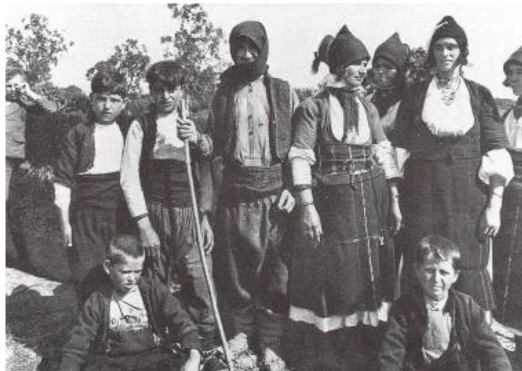
Φωτ. 21. - Οικογένεια του Γιδά