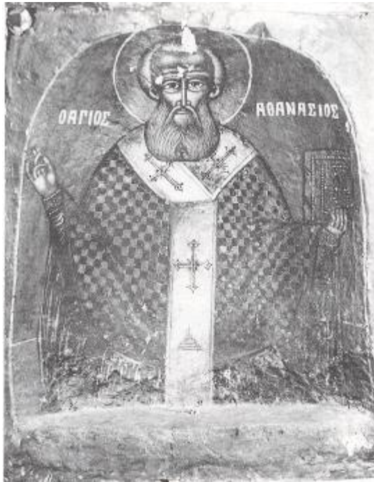
Φωτ. 9 - Η εικόνα του Αγίου Αθανασίου

Το σημαντικότερο όμως γεγονός, που συνδέει η μνήμη των Γηδιωτών μ' εκείνη την εποχή, είναι η επίσκεψη του νεοαπόστολου Κοσμά του Αιτωλού. Διηγούνται λοιπόν πως στην παλιά εκκλησία του Αγίου Αθανασίου πέρασε, λειτούργησε και δίδαξε ο Άγιος Κοσμάς. Οι Χριστιανοί του Ρουμλουκιού στηρίχθηκαν τότε ψυχικά από τον Κοσμά Αιτωλό. Μιλώντας απλά, αλλά με δύναμη και ύφος προφήτη, εμπύχωνε τους χωρικούς, προφήτευε τη μελλοντική απελευθέρωση του ελληνικού γένους, και τους παρακινούσε να κτίζουν εκκλησίες και να ιδρύουν σχολεία.