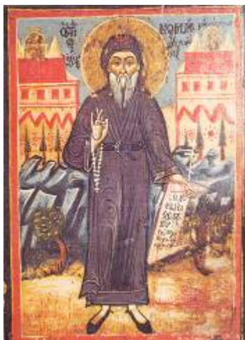
Φωτ. 11 - Ο Κοσμάς ο Αιτωλός

συνδέσουμε, αφ' ενός με τις υστερότερες χρονολογίες 1777 και 1778 που χαραχτήκαν στην εκκλησία του Αγίου Αθανασίου και αφ' ετέρου με την ιδιαίτερη προσπάθεια που κατέβαλε ο Κοσμάς να παρακινεί τους σκλαβωμένους τότε Έλληνες να χτίζουν εκκλησίες και σχολεία, πρέπει να δεχθούμε πως το χτίσιμο της παλιάς εκκλησίας του Αγ. Αθανασίου του Γιδά ήταν καρπός του κηρύγματος του φλογερού εκείνου ιεροκήρυκα και πατριώτη.