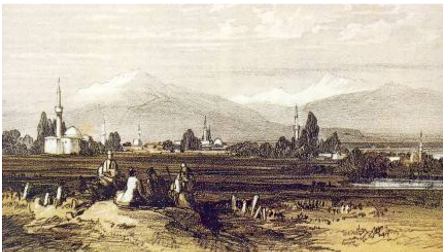
Φωτ. 13. - Τα Γιαννιτσά και η λίμνη

πληροφορούμαστε ότι στο Ρουμλούκι αρματολός ήταν “... Ο αείμνηστος ... Γερο - Καρατάσιος, εἰς των πρωτίστων αρματολῶν της Μακεδονίας, πολύ προ του αγώνος οπλισθείς κατά των τυράννων, ου μόνον υπήρξε , ... το φόβητρον της δυνάμεώς των και ἤνοιξε τους τάφους χιλιάδων εχθρῶν, ἀλλά και ἐπὶ τεσσαράκοντα ἔτη ἐξέτεινε την κυριαρχίαν του ἐπὶ των ἐπαρχιών, της Βερροίας, των Γιαννιτσῶν, και του Βαρδαρίου, ὅπου μόνον ηκούετο των ὄπλων του η κλαγγή και μόνος ἦταν νόμος η θέλησίς του. ...”