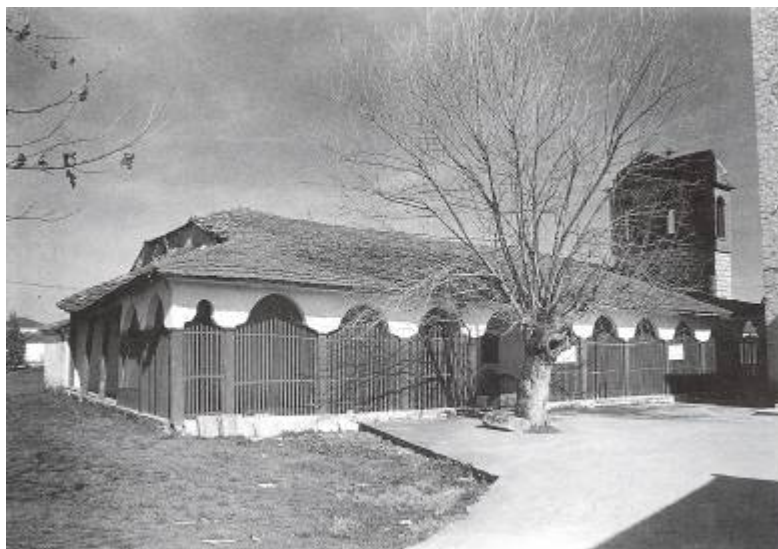
Φωτ. 19. - Μονή Αγίων Αναργύρων Νησίου

Από αυτή την αναφορά πληροφορούμαστε την ύπαρξη και το σημαντικό έργο του καταγόμενου από τον Γηδά οπλαρχηγού, που καταδεικνύει την ενεργό συμμετοχή των κατοίκων του κάμπου του Ρουμλουκιού καθ' όλη την διάρκεια των επαναστατικών γεγονότων.