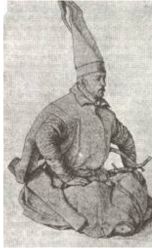
Φωτ. 1. - Ο γενίτσαρος

Όταν ανακόπηκε ο επεκτατισμός των Τούρκων στα τείχη της Βιέννης, κι όταν άρχισαν να χάνουν μάχες και εδάφη οι Οθωμανοί, η απελπιστική κατάσταση των υπόδουλων ραγιάδων άρχισε να αλλάζει προς το καλύτερο.