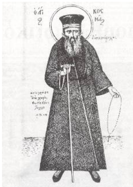
Φωτ. 10 Κοσμάς ο Αιτωλός

Το σημαντικότερο όμως γεγονός, που συνδέει η μνήμη των Γηδιωτών μ' εκείνη την εποχή, είναι η επίσκεψη του νεοαπόστολου Κοσμά του Αιτωλού. Διηγούνται λοιπόν πως στην παλιά εκκλησία του Αγίου Αθανασίου πέρασε, λειτούργησε και δίδαξε ο Άγιος Κοσμάς. Οι Χριστιανοί του Ρουμλουκιού στηρίχθηκαν τότε ψυχικά από τον Κοσμά Αιτωλό. Μιλώντας απλά, αλλά με δύναμη και ύφος προφήτη, εμπύχωνε τους χωρικούς, προφήτευε τη μελλοντική απελευθέρωση του ελληνικού γένους, και τους παρακινούσε να κτίζουν εκκλησίες και να ιδρύουν σχολεία.