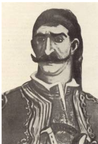
Φωτ. 12 – Αναστάσιος Καρατάσιος

Η κάθοδος των Ρώσων στην Βλαχία, η προκήρυξη του Ρώσου ναύαρχου Σενιάβιν τους Έλληνες αρματολούς να ενισχύσουν τον Αγώνα του και ο ενθουσιασμός που κατέλαβε τους Έλληνες αρματολούς, ώθησαν και τον Νικοτσάρα να κατευθυνθεί στη Σερβία ή προς τις ηγεμονίες του Δουνάβεως, όπως ήδη έκαναν πολλοί άλλοι συμπατριώτες του, όπως ο Γεωργάκης Ολύμπιος. Ο Σάθας υποστηρίζει ότι ο Νικοτσάρας από τη Σκόπελο αποβιβάσθηκε στην Κατερίνη στις 23 Ιουλίου 1807 με 550 εκλεκτούς άνδρες και δια των Πιερίων, εισήλθε στο Ρουμλούκι, πέρασε τις γέφυρες του Αλιάκμονα, του Καρά Ασμάκ (Λουδία) και του Αξιού.