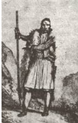
Φωτ. 4 - Κλέφτης

είχε πάρει, φαίνεται. μεγάλες διαστάσεις. Αρκετοί χωρικοί ερχόταν σε απευθείας συνεννόηση με τους εμπόρους για την πώληση των σιτηρών τους, στις δαιδαλώδεις εκβολές ποταμών, στο Καραβοστάσι στο Πλατύ, στο Κλειδί και στη Χαλάστρα. Οι Τούρκοι βέβαια έπαιρναν τα μέτρα τους, αφού το 1737 αναφέρεται ότι δύο αγάδες ήταν επιφορτισμένοι με την δίωξη του λαθρεμπορίου στον κόλπο της Θεσσαλονίκης.