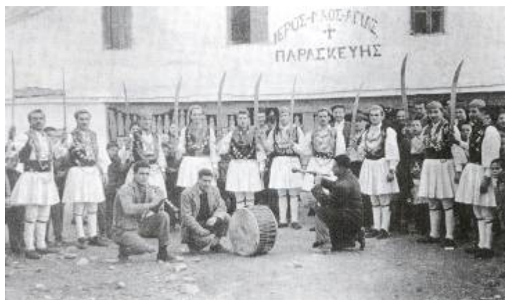
Φωτ. 5 – Ρογκάτσια

Παράλληλα με τη σχετική ευημερία των Ελλήνων του κάμπου, κατά τον 18 ο αιώνα αναπτύχθηκε και η ένοπλη αντίσταση. Τον 18 ο αι. οι κλεφταρματολοί των Πιερίων και του Βέρμιου κατορθώνουν να εμπνέουν φόβο και κάποτε και την ανοχή των τουρκικών αρχών. Οι κλέφτες με το ισχυρό τους μίσος εναντίον των κατακτητών και των συνεργατών τους, δεν έπαυσαν να αποτελούν αντιστασιακούς πυρήνες με δυναμική επιρροή πάνω στο αντιστασιακό φρόνημα του λαού. Τα βουνά της περιοχής είχαν γεμίσει κλέφτες, ώστε να μπορεί να πει κανείς πως μια άλλη ανεξάρτητη Ελλάδα ζούσε πάνω σ' αυτά. Αυτοί, ως αρματολοί, είχαν αναλάβει από την τουρκική διοίκηση τη φύλαξη των χωριών του κάμπου από τους ληστές και τις άτακτες ομάδες των Αλβανών, που έκαναν επιδρομές στα χωριά για λαφυραγωγία.