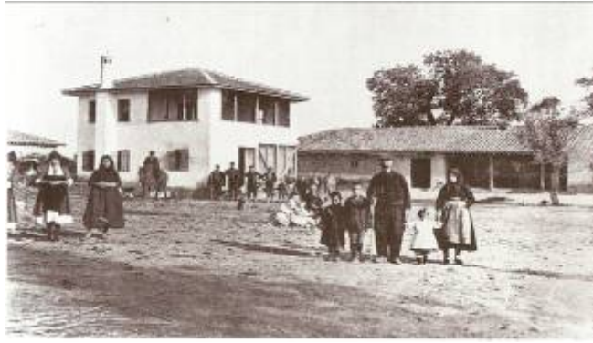
Εικόνα 5: Αρχοντικό στο Τσινάφορο (Πλάτανος), 1924.

Τα ραγαζόσπιτα, που αποτελούσαν τον συνηθέστερο τύπο ρουμλουκιώτικου σπιτιού, διατηρώντας τα κύρια χαρακτηριστικά του ελληνικού και δη του πρωτόγονου μακεδονικού σπιτιού, είχαν σχήμα ορθογώνιου παραλληλόγραμμου. Το κάθε ρουμλουκιώτικο σπίτι χτίζονταν σε μια μεγάλη περιοχή, το σπιτότοπο. Τα ρουμλουκιώτικα χωριά δεν έδιναν την εντύπωση χωριού με τη συνηθισμένη εικόνα που έχουμε σήμερα λόγω ότι τα σπίτια ήταν μακριά το ένα από το άλλο και σκόρπια εδώ και εκεί. Ο σπιτότοπος ήταν περιτριγυρισμένος με φράκτη από πλεκτές βέργες λεπτοκαρυάς και αγκάθια, που ονομαζόταν πλόκος ή πλοκαρία. Ο φράκτης είχε σε ένα μέρος φαρδιά πόρτα για να μπαينوβαίνουν τα πρόβατα και τα βόδια και μία μικρότερη πόρτα κοντά στο σπίτι προς την αυλή για τους ανθρώπους 19 .