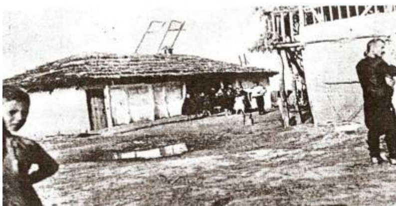
Εικόνα 8: Σπίτι μετά από γάμο. Απέναντι το αμπάρι.

Κοντά στο κυρίως σπίτι υπήρχαν βοηθητικά χτίσματα για τις ανάγκες της ζωής τους και της εργασίας τους. Απέναντι από το σπίτι ήταν το αμπάρι με δύο πατώματα. Το κάτω μέρος ήταν χτιστό και χρησίμευε ως αποθήκη και το πάνω μέρος ήταν στεγασμένο με βούρλα ορθάνοιχτα από τα πλάγια. Εκεί μαζεύονταν στους γάμους οι άντρες για να γλεντήσουν.