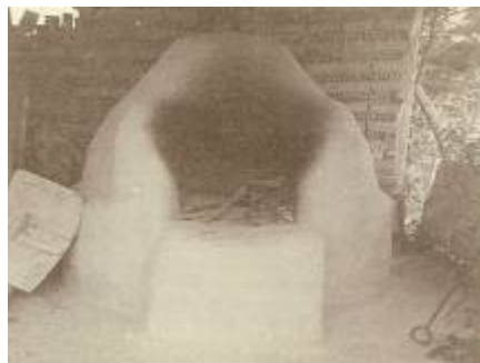
Εικόνα 10: Κωνοειδής φούρνος.

Ακόμη, στο οικόπεδο υπήρχαν χτίσματα όπως το κοτσερό ή κουτσερός για την αποθήκευση καλαμποκιών, ο αχυρώνας, η παχιά, ο νόβρος για τα γελάδια και το τσαρδάκι για τα πρόβατα. Όλα αυτά ήταν φτιαγμένα από ξύλα και δοκάρια και σκεπασμένα με ραγάζι.