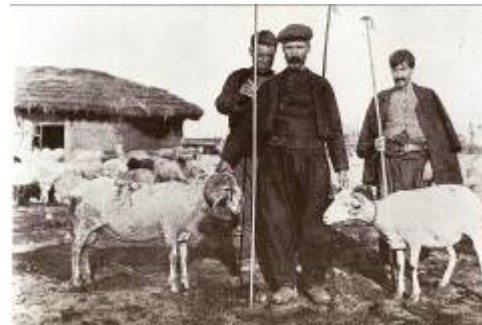
Εικόνα 2: Κτηνοτρόφοι στο Ρουμλούκι.

Οι Τούρκοι που έμεναν μόνιμα στην περιοχή ήταν πολύ λίγοι. Οι Ρουμλουκιώτες χωρικοί δούλευαν στα τούρκικα χτήματα (τσιφλίκια) για να επιβιώσουν. Ο φόρος ήταν περίπου το 60% της σοδειάς και οι γεωργοί αναγκάζονταν να μηχανεύονται διάφορους τρόπους για να παρουσιάσουν μικρότερη σοδειά. Στην κτηνοτροφία οι Τούρκοι δεν επέβαλλαν φόρο και για αυτόν τον λόγο σχεδόν όλοι οι χωρικοί στο σπίτι τους ή και έξω στα βοσκοτόπια εκτρέφανε πολλά ζώα. Πολλοί Ρουμλουκιώτες ιδιαίτερα από περιοχές κοντά στο Βάλτο ασχολούνταν και με το ψάρεμα. Ψάρευαν κυρίως γριβάδια, γουλιανούς, χέλια και πρίκια στη λίμνη των Γιαννιτσών, το Λουδία και τον Αλιάκμονα.