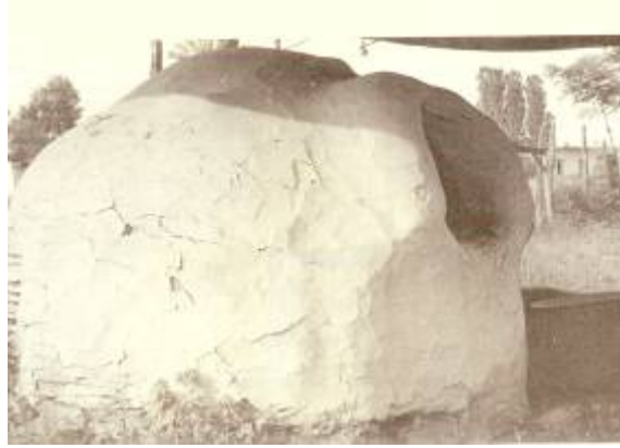
Εικόνα 9: Μεγάλος φούρνος παλαιού τύπου.