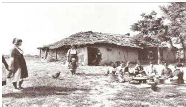
Εικόνα 4: Ραγαζόσπιτα στο Γιδά το 1924.

Το σπίτι στο Ρουμλούκι αποτελεί τον τύπο του απλού μακεδονικού σπιτιού και μπορεί να χρησιμεύσει για βάση στη μελέτη της εξέλιξης του αρχοντικού μακεδονικού σπιτιού 17 . Τα σπίτια του Ρουμλουκιού είναι μονόπατα στρωτά και χαμηλά και σπανιότερα δίπατα, ψηλά και ανωγαστά. Τα ρουμλουκιώτικα σπίτια που βρίσκονταν πέρα από τον Αλιάκμονα και κοντά στα βόρεια υψίπεδα των Πιερίων, ήταν κυρίως φτιαγμένα από πλίθια ή πέτρες από Καταφυώτες μάστορες που κατάγονταν από το Καταφύγι Κατερίνης και από γκέκηδες κεχαγιάδες (νομάδες). Τα περισσότερα, όμως, ρουμλουκιώτικα σπίτια βρίσκονταν κοντά στο Βάλτο ή στις όχθες του Αλιάκμονα και ήταν πιο πρόχειρα φτιαγμένα λόγω του φόβου πλημμυρών και με ντόπια υλικά όπως το ραγάζι (είδος καλαμιού) και η ρακίτα (είδος θάμνου). Τα σπίτια αυτά κοντά στο Βάλτο ονομαζόταν ραγαζόσπιτα 18 .