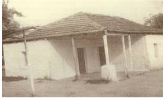
Εικόνα 6: Ρουμλουκιώτικο σπίτι με μπρόστια, χτισμένο στα μέσα της δεκαετίας του 1920.

Από τα μπρόστια μέσω μίας χαμηλής πόρτας εισέρχονταν στην κεντρική κάμαρα, που λεγόταν κάθισμα, σπίτι ή νοντάς (οντάς), όπου ήταν ο χώρος υποδοχής και φιλοξενίας των επισκεπτών. Η κεντρική κάμαρα συνήθως ήταν σανιδωμένη σε αντίθεση με τα πατώματα των άλλων δωματίων που ήταν χωμάτινα. Επίσης, η κεντρική κάμαρα διέθετε στο μέσο του τοίχου ένα χτιστό περιποιημένο τζάκι.