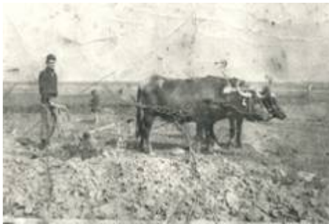
Εικόνα 1: Όργωμα.

Τα κυριότερα επαγγέλματα των κατοίκων του Ρουμλουκιού προς τα τέλη του 19 ου αιώνα ήταν γεωργοί, ζευγαράδες και κτηνοτρόφοι. Κάποια άλλα επαγγέλματα των κατοίκων ήταν γανωτήδες, τσαγκαράδες, ράφτες και φυσικά δάσκαλοι και ιερείς.