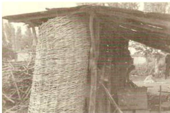
Εικόνα 11: Κουτσερός κατασκευασμένος με πλόκο από βέργες ρακίτας.

Ακόμη, στο οικόπεδο υπήρχαν χτίσματα όπως το κοτσερό ή κουτσερός για την αποθήκευση καλαμποκιών, ο αχυρώνας, η παχιά, ο νόβρος για τα γελάδια και το τσαρδάκι για τα πρόβατα. Όλα αυτά ήταν φτιαγμένα από ξύλα και δοκάρια και σκεπασμένα με ραγάζι.