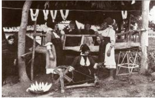
Εικόνα 3: Γυναίκες του Ρουμλουκιού υφαίνουν.

Οι αργαλειοί που χρησιμοποιούσαν ήταν δύο ειδών, ο στρωτός ή καθούμενος και ο περπατάρικος. Τα αδράχτια, σφοντύλια, νήματα, μαντίλια, κλωστές και κομποβέλονα τα προμηθεύονταν από τους αρκουδιάρηδες ή γιούφτους, όπως τους έλεγαν, δίνοντας τους καλαμπόκι, στάρι, αλεύρι και άλλα. Οι αρκουδιάρηδες (γυρολόγοι) τριγυρνούσαν από χωριό σε χωριό με μια αρκούδα εκπαιδευμένη για να διασκεδάζει τους χωρικούς και ταυτόχρονα έκαναν ανταλλακτικό εμπόριο με τους κατοίκους.