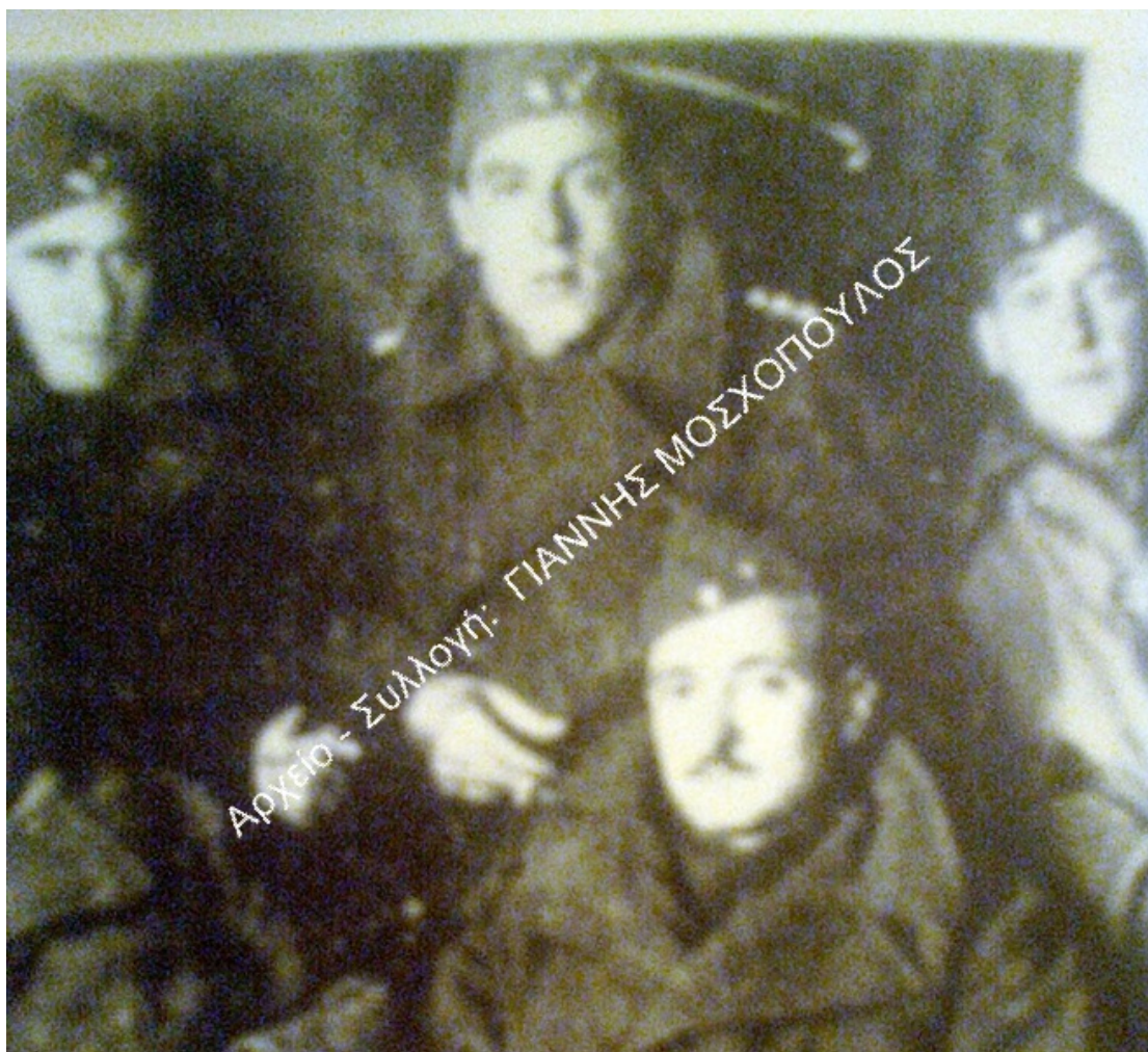
Φωτ. 2. Ο Γ.Παπαζήσης (επάνω στο κέντρο).

Σαράφης 1946: Στρατηγού Στέφανου Σαράφη, Ο ΕΛΑΣ, έκδ. «Τα νέα βιβλία» Α.Ε., Αθήνα 1946.